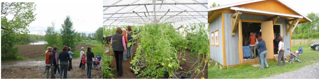
De gauche à droite : les champs sur le bord de la rivière Chateauguay, la serre débordante de tomates et de concombres et le kiosque où l'on peut déjà acheter tomates, concombres, pommes de terre, fines herbes, produits équitables, semences et petits plants.

Cette ferme approvisionnait 2 CPE de la région en 2005. Elle approvisionne aussi directement des familles via la formule de l'Agriculture soutenue par la communauté, qui seront au nombre de 80 cette année. Cette visite voulait permettre aux parents et au personnel des CPE qui sont associés ou souhaitent s'associer avec cette ferme de se familiariser, d'en apprendre davantage sur l'agriculture biologique et de faire connaissance avec les personnes qui cultivent leurs légumes.