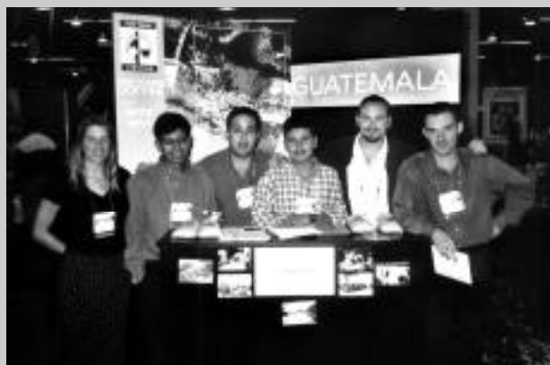
SCAA, Anaheim, 2002

» For the fourth consecutive year, representatives of Équiterre's fair trade program attended the annual coffee show of the Specialty Coffee Association of America in Anaheim, California, the world's largest coffee industry gathering. In their strategic role as translators at the stand of TransFair USA, the US fair trade certifier, they helped make connections between producers' groups (including three in Latin America with which Équiterre has worked for several years) and other coffee industry players.