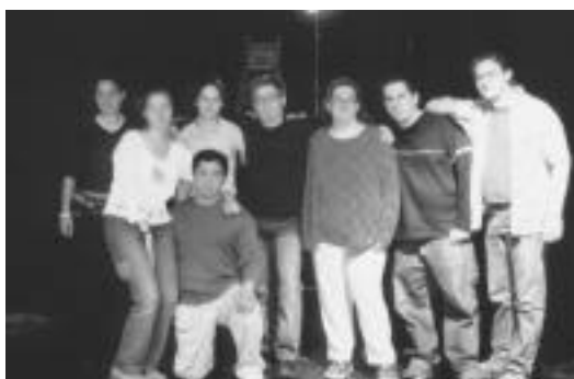
Des étudiants du collège Marie-Victorin

Mélanie Fortin Agente d'information Commerce équitable