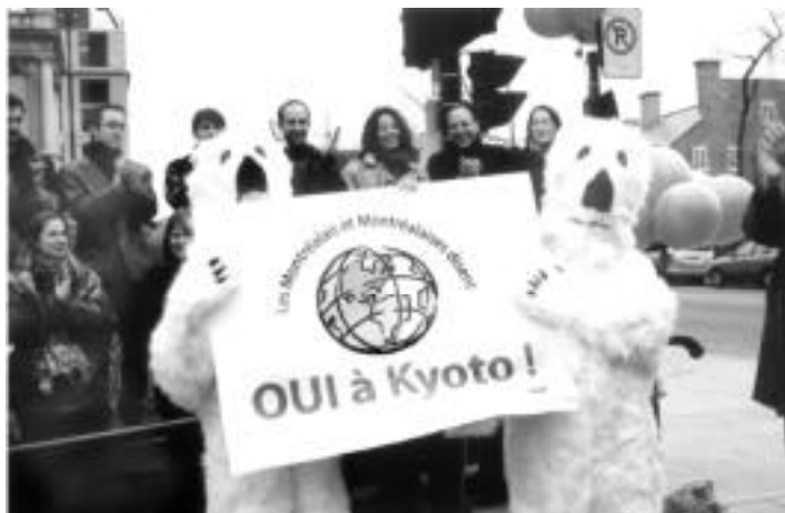
Des membres d'Équiterre appuyant la ratification de Kyoto

Durant les derniers mois, Équiterre a contribué de plusieurs façons au développement de ce futur plus écologique. Le 22 avril dernier, jour de la Terre, des membres d'Équiterre se sont dirigés vers l'hôtel de ville de Montréal, accompagnés des «ours