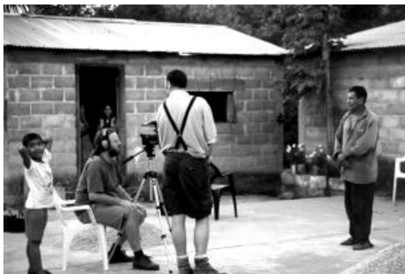
Lors du tournage de la vidéo L'utopie caféinée