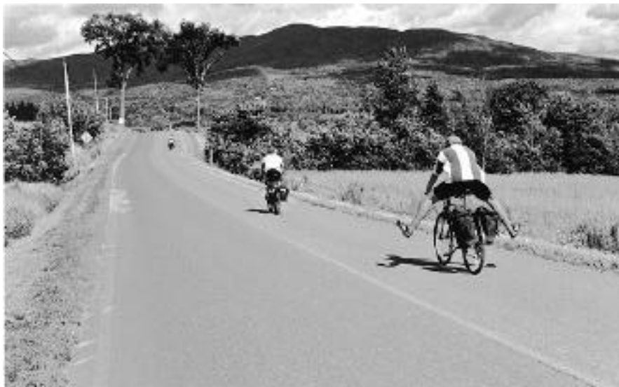
La tournée à vélo 2001.

Réservez vos dates : Libre comme l'air , du 10 au 15 août 2002. Venez pédaler avec des membres d'Équiterre durant notre randonnée à vélo annuelle. Cette randonnée est une occasion idéale pour prendre des vacances écologiques et découvrir une région du Québec. Les repas gastronomiques sans pareil seront préparés par un cuisinier professionnel et nous transporterons vos bagages. Vous n'aurez qu'à pédaler dans les sentiers, les routes et les pistes champêtres les plus paisibles du Québec