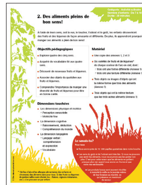
Exemple de fiche d'activité